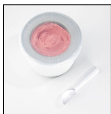
GRANDE CUVE A MÉLANGER

Grande cuve à mélanger avec une capacité de 1,5 l, pour la préparation de 800 g de glace.