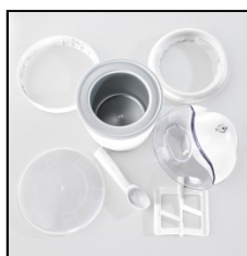
FACILE A NETTOYER

Grande cuve à mélanger avec une capacité de 1,5 l, pour la préparation de 800 g de glace.