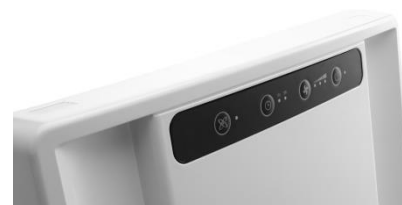
PANNEAU DE COMMANDE SOFT TOUCH

Il génère des ions négatifs qui amalgament les particules en suspension. En les chargeant positivement, la poussière, les pollens, les poils d'animaux et tout autre composé organique volatil (COV) nocif tombent au sol ou sont aspirés par le purificateur