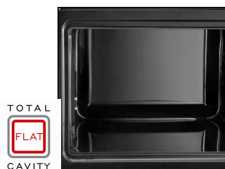
TOTAL FLAT CAVITY