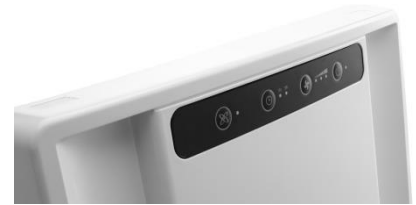
SOFT TOUCH BEDIENINGSPANEEL

Eerste stap van luchtreiniging dankzij de ionisator die de stofdeeltjes, pollen en geur in de lucht neutraliseert.