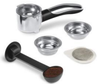
NIEUWE CREMA FILTERHOUDER

2 in 1: de nieuwe crema filter is zowel geschikt voor ESE-servings als gemalen espressokoffie.